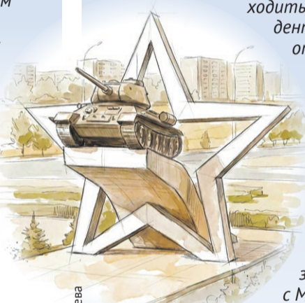
Иллюстрация: Елена Пантелеева

«Я могу с уверенностью заявить: не только те парни, которые сейчас на фронте, все наши студенты – это надежное будущее, настоящая опора страны. Ребята активно собирают гуманитарную помощь для бойцов СВО, никогда не пройдут мимо чужой беды. Главное – уметь достучаться до них, говорить с ними искренне и на равных. Что мы, собственно, и делаем».