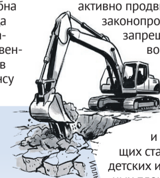
Иллюстрация: Алексей Фролов

«Застройщики бездумно роют глубокие котлованы, обустроят подземные паркинги и забивают шпунты в водоохраных зонах. И даже не задумываются о том, чем эти агрессивные операции грозят знаменитым липецким источникам минеральной воды. Мы рискуем навсегда потерять главное природное богатство нашего города ради сиюминутной выгоды строительных компаний».