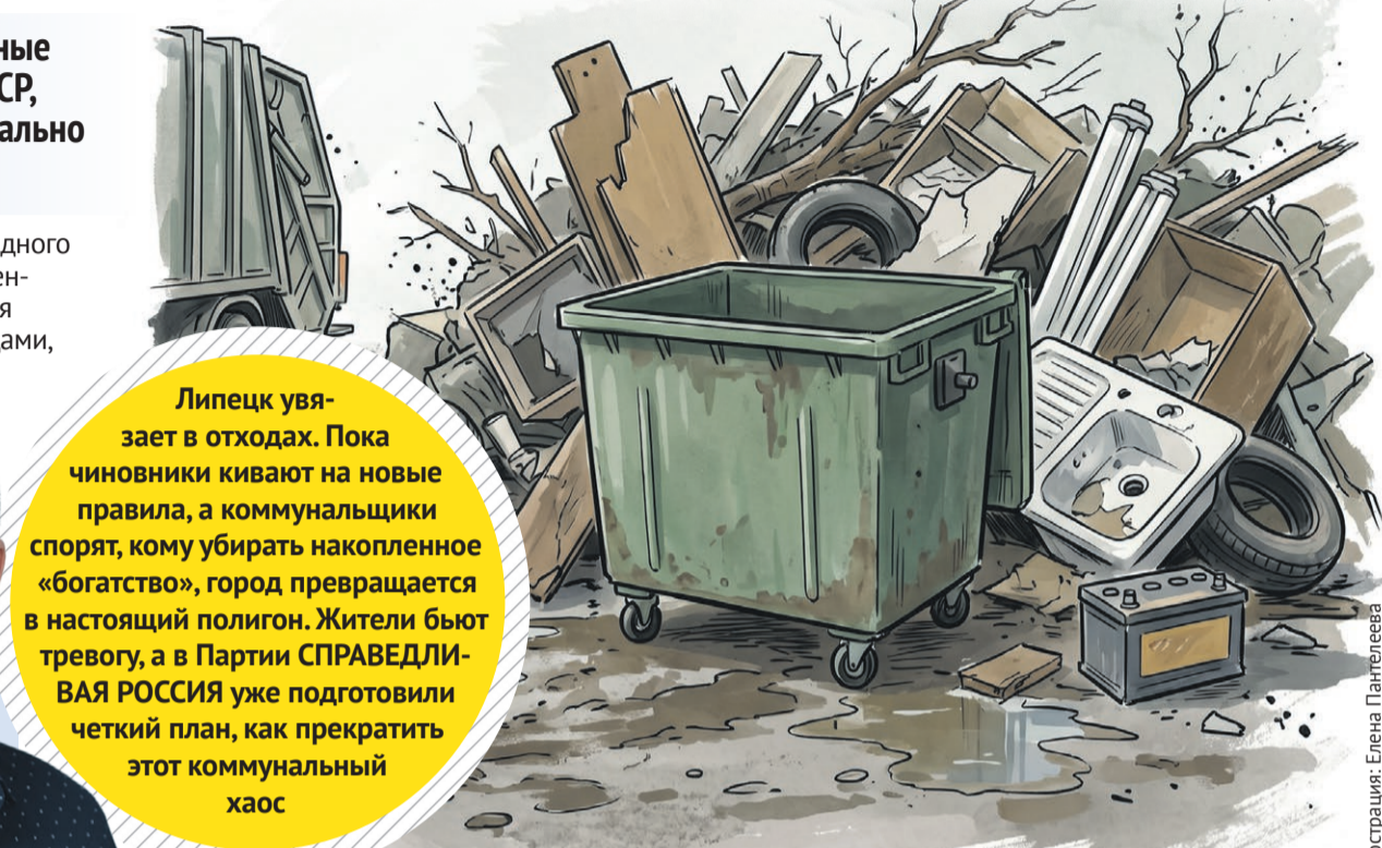
Иллюстрация: Елена Пантелеева

Липецк увязает в отходах. Пока чиновники кивают на новые правила, а коммунальщики спорят, кому убирать накопленное «богатство», город превращается в настоящий полигон. Жители бьют тревогу, а в Партии СПРАВЕДЛИВАЯ РОССИЯ уже подготовили четкий план, как прекратить этот коммунальный хаос