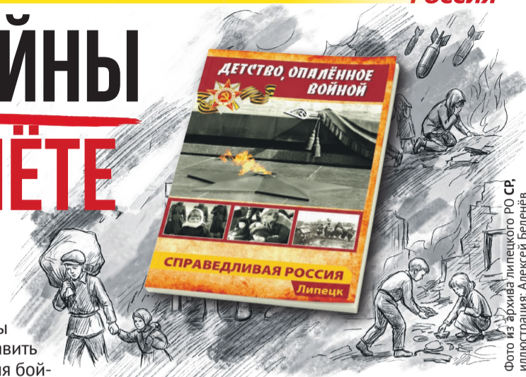
Фото из архива липецкого РО СК. Иллюстрация: Алексей Бенелен

«Мы долгие годы надеялись что он вернется, – делится воспоминаниями женщина. – Но, к сожалению, этого не произошло... И что мы видели? Мамыны слезы и трудности, она осталась совершенно одна с тремя совсем маленькими девочками на руках».