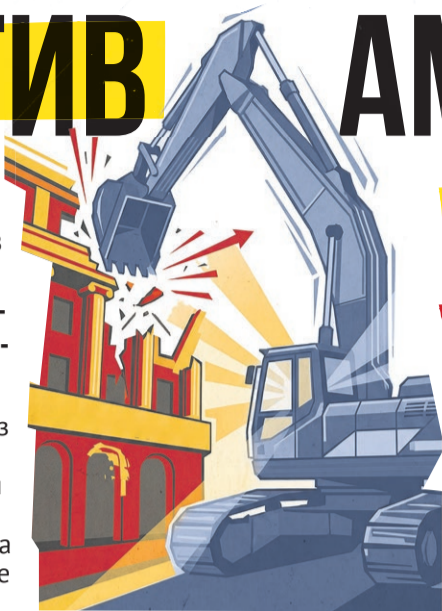
Иллюстрация: Алексей Беленёв