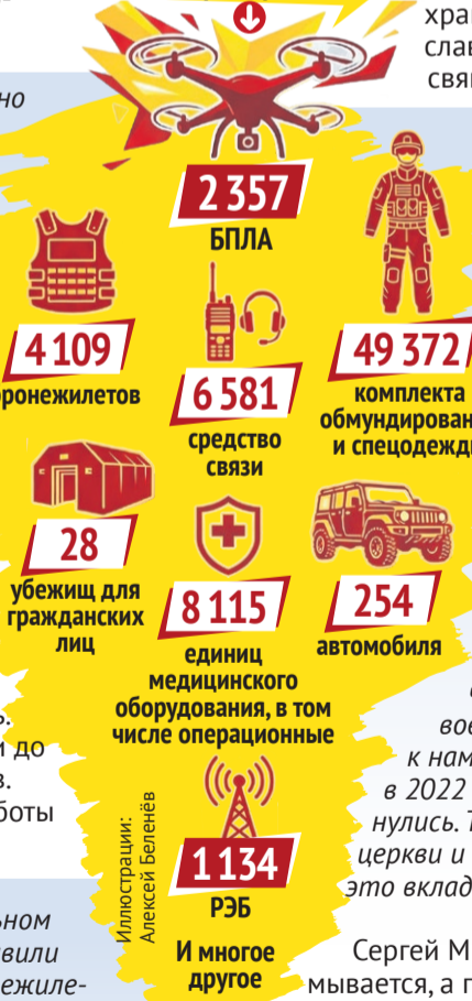
Иллюстрация: Алексей Беленев

Благотворительный фонд Сергея Михеева приобрел