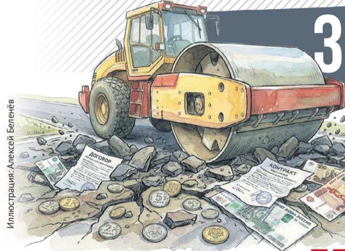
Иллюстрация: Алексей Беленев

Весна 2026 года в очередной раз подтвердила: несмотря на миллиардные вливания, хороший асфальт в России остается явлением сезонным. Но решение у этой вечной российской беды все же есть.